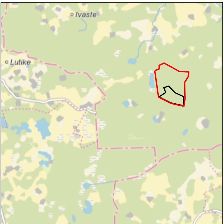
Kaardileht nr 5423 Kanepi